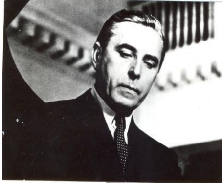
Rudolf Firkušný (1912 Napajedla – 1994 Staatsburg)

V roce 2014 proběhl již 14. ročník koncertů Setkání s hudbou – Pocta Mistru Rudolfu Firkušnému jako každoroční vzpomínka na tohoto pianistu a současně jako dárek k jeho narozeninám.